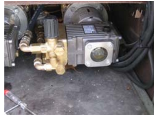
Ölstand der Pumpen prüfen (Sichtprüfung)