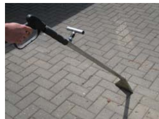
Lanze für Kleinflächen