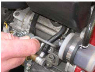
Ölstand am Generator prüfen