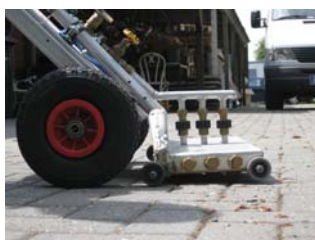
Doppellanze mit Doppelschlauch