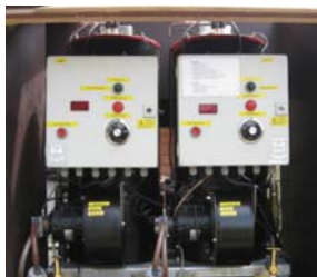
2 ölbeheizte Brenner

Das TopTherm-System setzt sich aus diesen Komponenten zusammen: